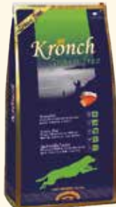
Grain free: Adult